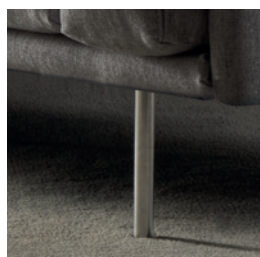
PIEDI CILINDRICI IN ACCIAIO CYLINDRICAL STEEL FEET

A richiesta sono disponibili piedi a vista cilindrici (diametro mm 20) in acciaio disponibili nella finitura cromata lucida o verniciata bronzo. Si prega di specificare le finiture al momento dell'ordine.